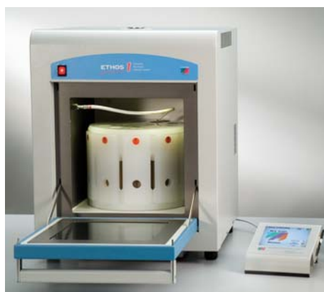
図 1. ETHOS 1

し、抽出温度を制御した。抽出時には温度プロファイルを指定し、これを実現するようにマイクロ波の出力は自動調節される。